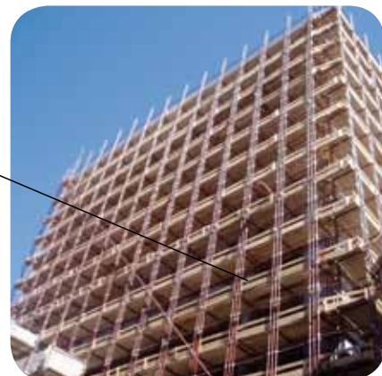
Villaggio Olimpico Torino 2006